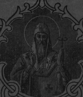
МИТРОПОЛИТЪ ОБИТЕЛИ СВАТИТЕЛЯ АЛЕКСІА СВАТИТЕЛЬ АЛЕКСІЙ МИТРОПОЛИТЪ МОСКОВСКОГО И ВСЕЯ РУСИ.