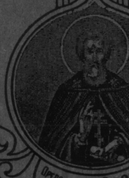
МИТРОПОЛИТЪ СЕР РАФИМЪ